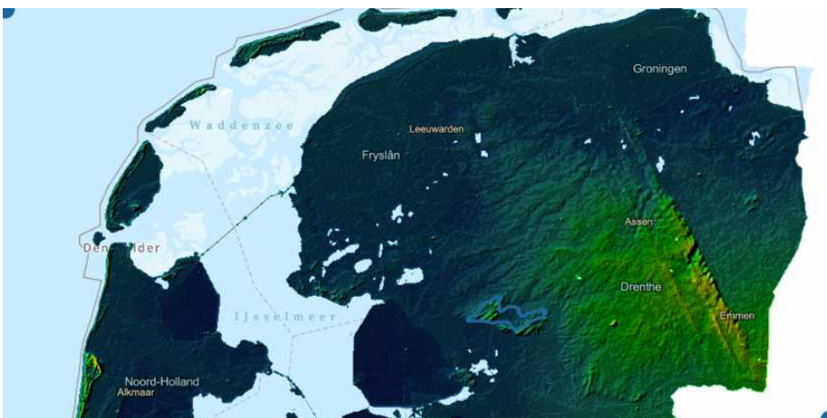
3 Het Steenwijker Heuvelland is een uitloper van het Drents Plateau.

Het Steenwijker Heuvelland ligt op de rand van het Drents Plateau, maar het hoort er niet echt bij.