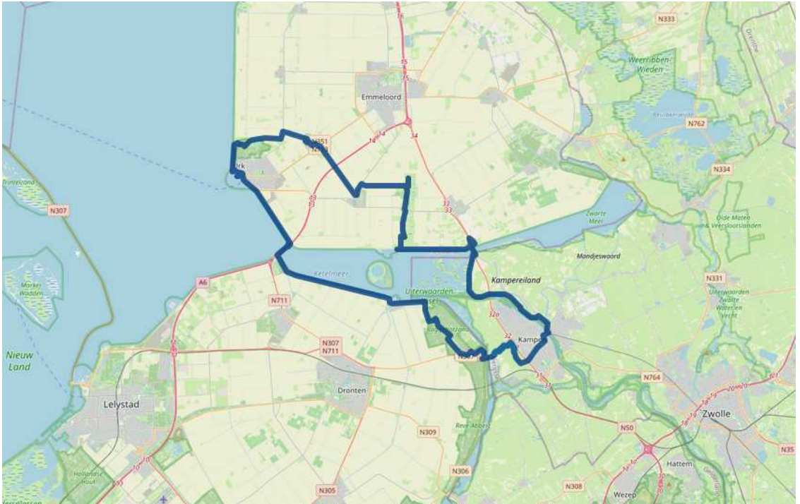
1 De fietsroute.